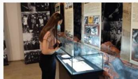
Первый посетитель по проекту «Пушкинская карта» Республиканский музей Боевой Славы